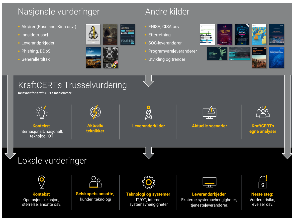
Figur 1: Sammenheng mellom vurderinger